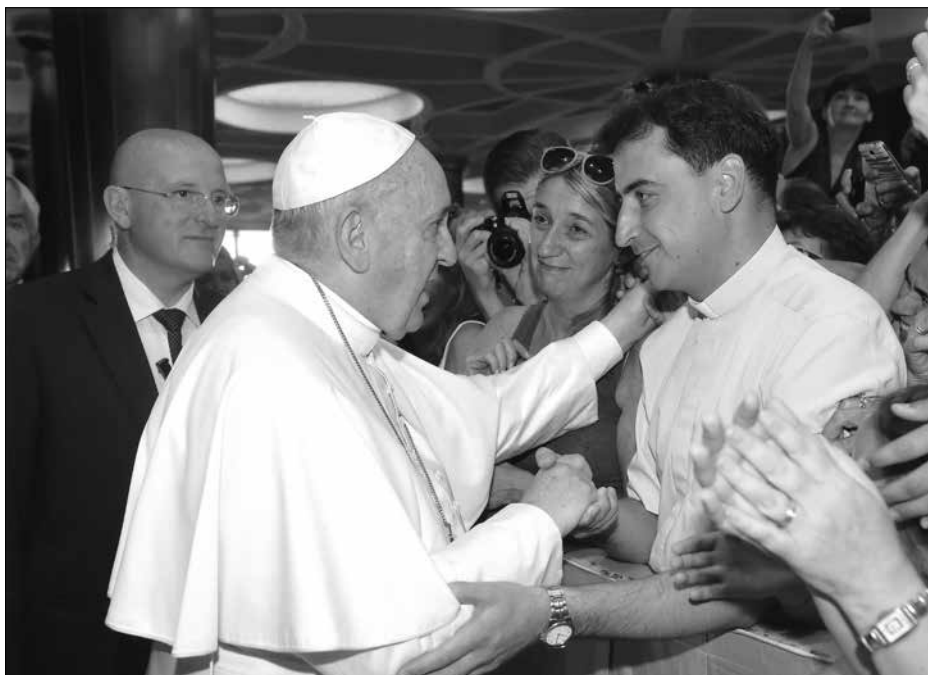
Ferenc pápával 2014. augusztus 20.

visszalépett hozzám és azt mondta: „és ne felejtsd el, imádkozni a rózsafüzéért!” Szavakkal kifejezhetetlen, és a szokásosnál is nagyobb lelkesedés fogadta Ferenc pápát augusztus 20-án, szerdán délelőtt a VI. Pál teremben megtartott általános kihallgatáson. A világ minden részéről érkezett hívőseregben nagy számmal voltak jelen dél-amerikaiak, afrikaiak, ázsiaiak. Honfitársai is lelkesen lobogtatták az argentin zászlókat. Bár már megszokták a hasonló jeleneteket, ezen a szerdán külö-